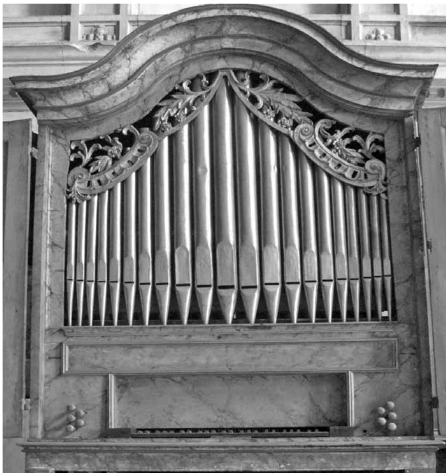
Imagem 1 - Órgão portátil (1790-91)

mónias que tinham lugar na Real Capela de S. Miguel” (BANDEIRA & QUEIRÓS, 2001-2002: 119).